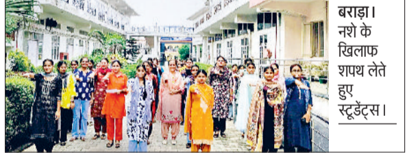
बराड़ा। नशे के खिलाफ शायत लेते हुए स्टूडेंट्स।