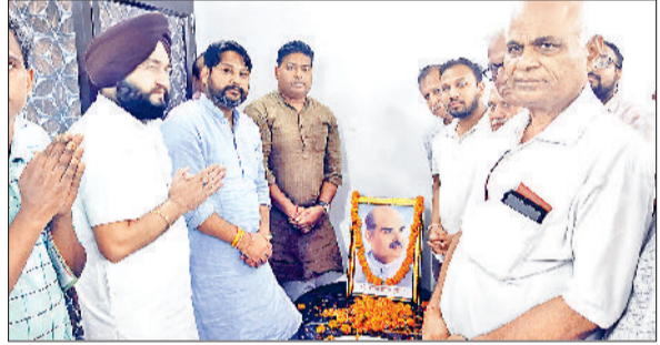
अंबाला। डॉ. श्यामा प्रसाद मुखर्जी को नमन करते भाजपा पदाधिकारी।