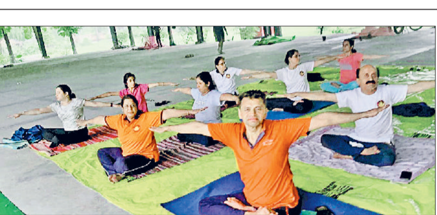
करनाल। फव्वारा पार्क सेक्टर में बारिश में भी योग करते साधक।

आस-पास के हजारों लोगों ने निगम परिसर में आकर भोजन प्रसाद ग्रहण किया और इसमें शामिल हलवा, पुरी, सब्जी, कढ़ी, चावल व खीर जैसे स्वादिष्ट व्यंजनों का लुप्त उठाया। दोपहर पूर्व करीब साढ़े 11 बजे जैसे ही भोजन वितरण का कार्यक्रम शुरू हुआ, कुछ ही देर बाद भोजन ग्रहण करने वालों का तांता लग गया। इनमें राह चलते लोग, ऑटो-रिक्शा चालक, आस-पास कार्यालयों के सरकारी अधिकारी व कर्मचारी तथा निगम कार्यालय में आए नागरिक