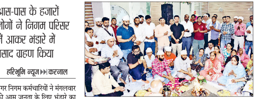
करनाल। भंडारे से पूर्व हवन में आहुतियां डालते आयोजक।

आस-पास के हजारों लोगों ने निगम परिसर में आकर भोजन प्रसाद ग्रहण किया और इसमें शामिल हलवा, पुरी, सब्जी, कढ़ी, चावल व खीर जैसे स्वादिष्ट व्यंजनों का लुप्त उठाया। दोपहर पूर्व करीब साढ़े 11 बजे जैसे ही भोजन वितरण का कार्यक्रम शुरू हुआ, कुछ ही देर बाद भोजन ग्रहण करने वालों का तांता लग गया। इनमें राह चलते लोग, ऑटो-रिक्शा चालक, आस-पास कार्यालयों के सरकारी अधिकारी व कर्मचारी तथा निगम कार्यालय में आए नागरिक