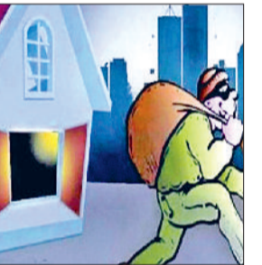
कि वह यूके में रहता है। उसने कहा कि जब वह यूके में रहता है तो कुछ चाबियां अपने रिसेप्शन वाले युवक को देकर रखता था।