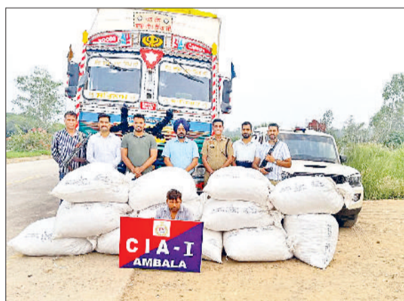
अंबाला। चुरापोस्त के साथ पकड़ा गया आरोपी ट्रक चालक।

सीआईए-वन की टीम ने नशे के खिलाफ चलाए जा रहे अभियान में बड़ी सफलता हासिल की है। पुलिस ने चौकलेट बिरिकट की आड़ में की जा रही नशीले पदार्थों की तस्करी का भंडाफोड़ करते हुए 4 क्विंटल 76 किलो चुरा पोस्त बरामद किया है। पुलिस द्वारा इस वर्ष-2025 में मादक पदार्थों के 71 मामले दर्ज करके 117 आरोपियों को गिरफ्तार कर जेल में भेजा गया है। मादक पदार्थों में अफीम 5 किलो 431 ग्राम 650 मिलिग्राम व अफीम के पौधे 8 किलो 140 ग्राम, डोडा चुरापोस्त 583 किलो 738 ग्राम, हैरोइन 02 किलो 815 ग्राम 183 मिलिग्राम, चरस 772 ग्राम, गांजा 24 किलो 580 ग्राम, स्मैक 59 ग्राम 666 मिलिग्राम, नशीली गोलियाँ 24300 व नशीले कैप्सूल 5758