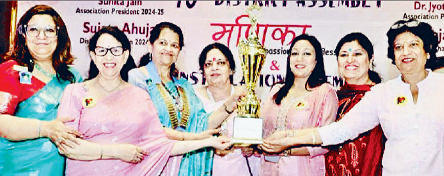
इनर व्हील क्लब पानीपत की प्रधान भूमिका गुप्ता प्लेटिनम अध्यक्ष की उपाधि प्राप्त करते हुए।