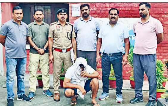
यमुनानगर। एंटी नारकोटिक सेल की टीम द्वारा अवैध शराब के साथ पकड़ा गया आरोपी महिंद्रा पिकअप चालक।