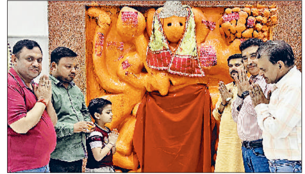
पानीपत। हनुमान चालीसा पाठ के दौरान मंदिर समिति के पदाधिकारी।

मॉडल टाउन स्थित भाटिया कॉलोनी के श्री गणेश मंदिर में मंगलवार को हनुमान चालीसा का पाठ कराया। यह पाठ प.विवेक शास्त्री ने कराया। प.विवेक शास्त्री ने बताया कि मंगलवार को हनुमान चालीसा का पाठ करने से हनुमान जी की कृपा प्राप्त होती है। जो भक्तों के कष्टों को दूर करते हैं और उन्हें संकटों से बचाते हैं। गणेश मंदिर में हनुमान चालीसा का पाठ करने से वातावरण पवित्र हुआ है। उन्होंने बताया कि हनुमान चालीसा का सात बार पाठ करना